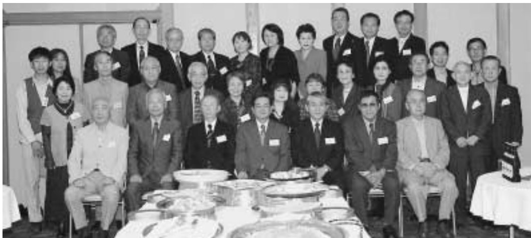
平成21年10月17日 於 大阪弥生会館