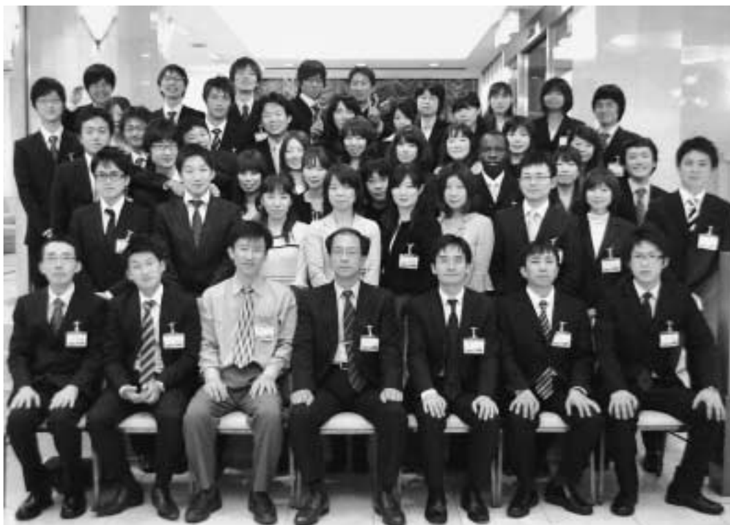
平成21年10月31日 於 長崎パークサイドホテル

なりました。ご参集いただいた先生方および卒業生、在学生、案内状の発送から会場設定までのお世話をしてくれた皆様方に深く感謝申し上げます。