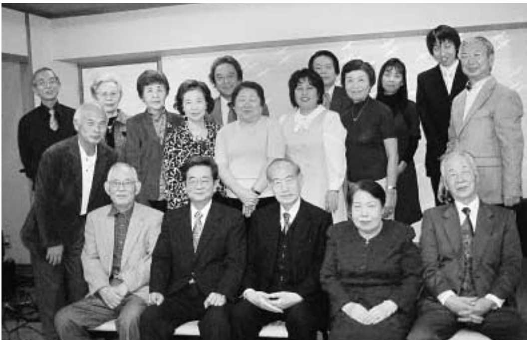
平成21年11月28日 於 佐世保グリーンホテル(活け洲博多屋)