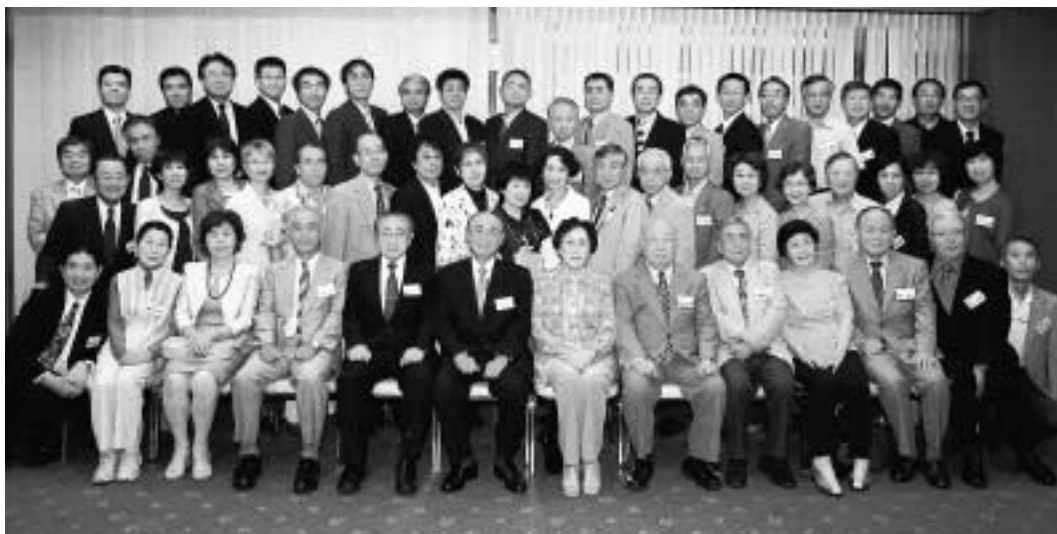
平成21年6月20日 於 華正楼（横浜中華街）