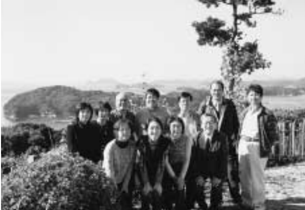
11月23日(月) 於 九十九島を眼下に「はな一」の中庭

2年に一回の同窓会は、卒後35年佐世保のハウステンボスにて11月22日(日)に開催いたしました。私は、4年前に地元の佐世保に帰り調剤薬局を開局しました。当初、開催場所の選択においていろいろ検討しましたが、ハウステンボスに決定したのは、円高によりアジアからの入場者が減少し、以前の活気がなくなってはいますが、晩秋の紅葉はすばらしく、イルミネーションによりライトアップされ、改めてハウステンボスの良さを皆に認識してもらいたためです。