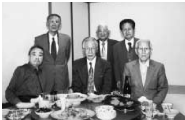
平成21年4月26日 於 セントヒル長崎