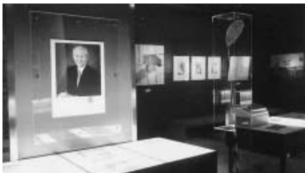
記念館内の展示風景

関係各位の多大なるご尽力を賜り、写真や資料など約80点余を所蔵することができました。特に、同窓生の皆様には、貴重な写真資料を快く提供していただきました。衷心より御礼申し上げます。