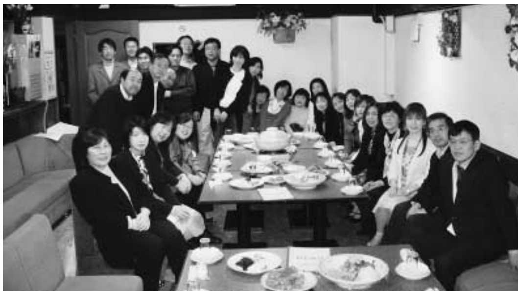
平成21年3月7日 於 フラワーメイト

“フラワーメイト”でのなごやかな懇談の後は、「キャンパス同窓会」らしく会場を薬学部に移し、“夜の薬学