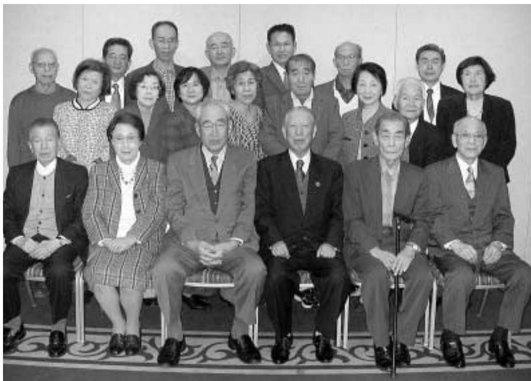
平成20年12月7日 於 ホテルグランドパレス諫早

蛇足になりますが、下村博士が青春時代を過ごされた諫早では、市広報の表紙に博士の顔写真が掲載され、博士が居住された町、博士の親族、受賞のもとになった業績などを紹介する特集が生まれ、博士が帰省された折には、諫早高校、市役所を訪問され、今でも諫早高校同窓会有志が博士の銅像を建てるために活動されています。