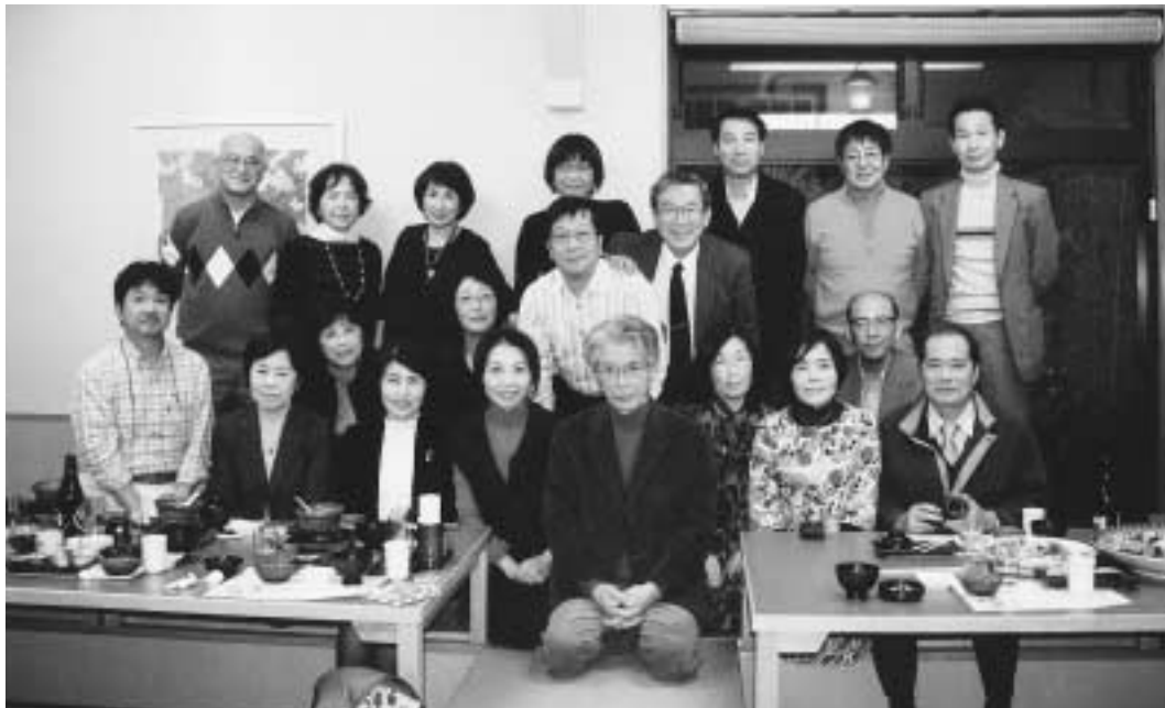
11月22日(日) 於 ハウステンボス内レストラン「花の家」

一次会が終わり外に出ると、ハウステンボス内はイルミネーションによりライトアップされていて、一番高いドムートルンが輝いていました。そこに生演奏とともに花火が始まりました。皆、しばらく夜空の花火に見とれていました。花火も終わりいざ二次会のフォレストヴィ