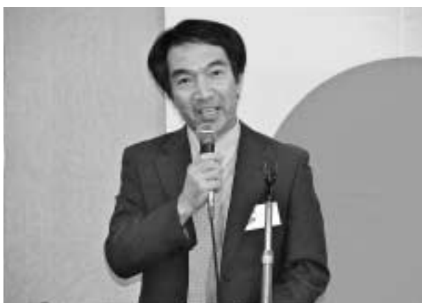
佐賀支部長 来年度定期総会のご案内