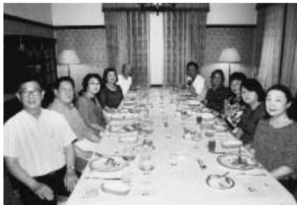
平成21年6月21日 於 日立目白クラブ