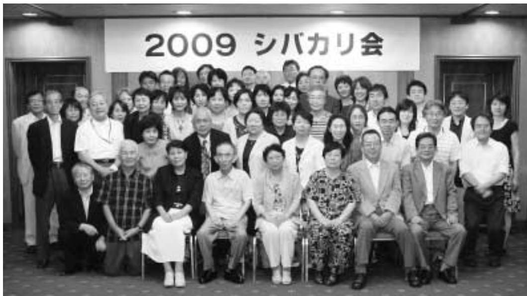
平成21年9月5日 於 セントラルホテルフクオカ