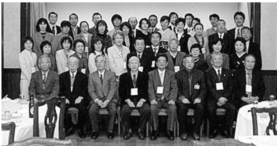
平成21年1月18日 於 グランドはがくれ