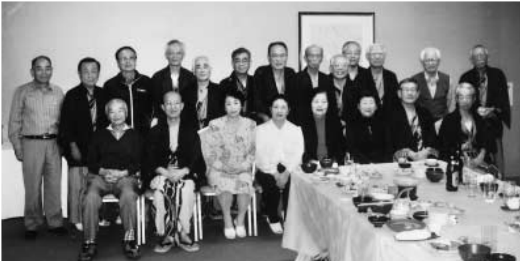
平成21年10月18日 於 唐津シーサイドホテル

さて、19日は朝一番に呼子朝市を訪れました。獲れたての魚介や野菜が所狭しと並べられ新鮮さと素朴さに感じ入った次第です。ここで各自それぞれ思いを込めて土産物を求めました。そのあと今から400年程前、全国平定を成し遂げた豊臣秀吉がさらに朝鮮半島、明国(今の中国)へ向けて出兵するため、その前進根拠地として築かせた名護屋城跡や玄界灘の荒波にさらされて出来た七つの洞窟が並んでいる七ツ釜を見学し、昼食をとったのち来年の再会を確認して解散しました。とても有意義な2日間でした。