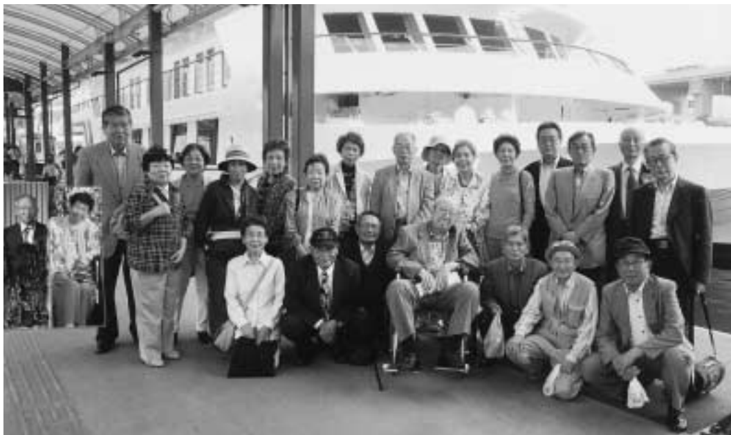
平成21年5月24日 於 ベイサイドプレイス