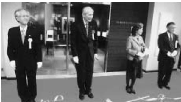
オープンセレモニーでのテープカット(2009年3月22日)

下村博士は、受賞のニュース後、超多忙なスケジュールに追われていらっしゃいましたが、ご快諾をいただき、2009年3月22日には、長崎大学名誉博士称号授与式、ノーベル化学賞受賞記念講演が行われました。当日はあいにくの雨でしたが、長大生や長崎市の中高生を始め、大変多くの皆様にお集まり頂き、博士の講演「ノーベル賞受賞の原点 - 長崎大学」に熱心に聞き入っていました。講演会後には、下村博士ご夫妻、片峰学長、畑山学部長の列席のもと、下村 脩名誉博士顕彰記念館(以後、記念館)のオープニングセレモニーが執り行われました。