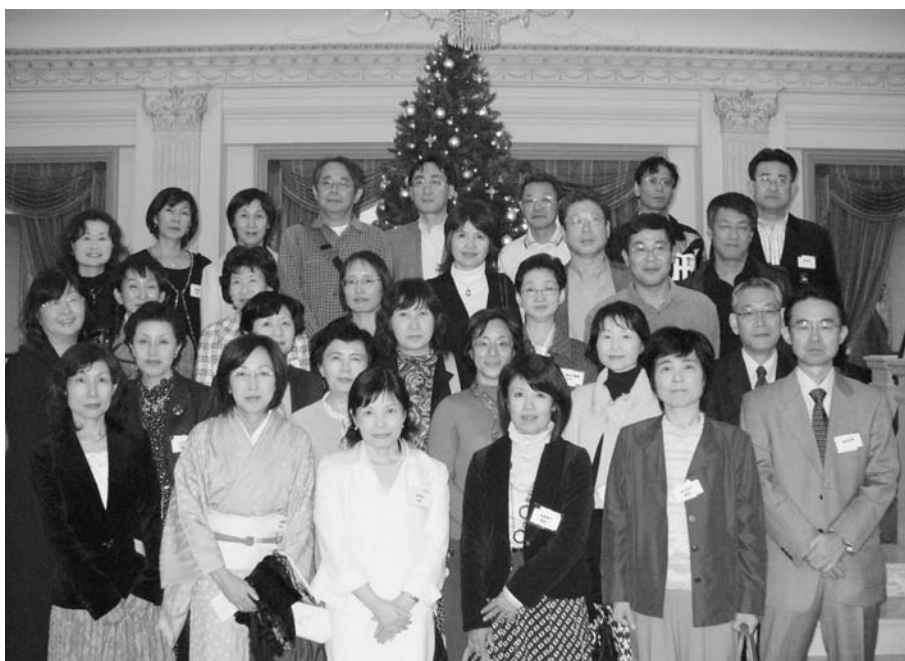
2007年11月10日 於 ハウステンボス