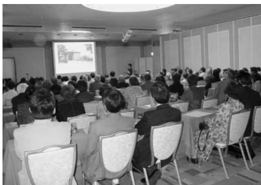
薬学部の新況報告