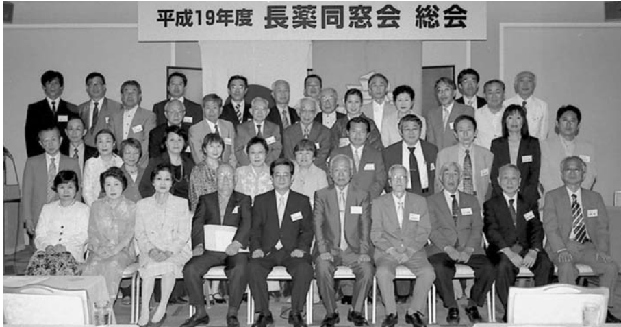
2007年6月9日 於 ホテルグランヴィア大阪