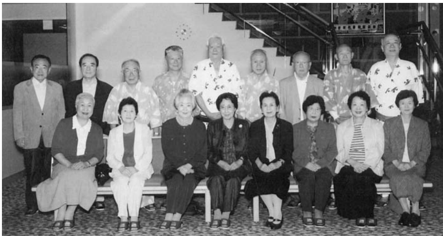
三朋会 平成19年10月17日 於 海峡ビューしものせき

宿舎の場所は関門橋を間近に望み、早鞆の瀬戸を眼下に見下ろす風景絶佳のところであり、翌朝、日の出の景色は素晴らしかった。早鞆の瀬戸の下関側は壇の浦である。昔、源平最後の合戦がこの