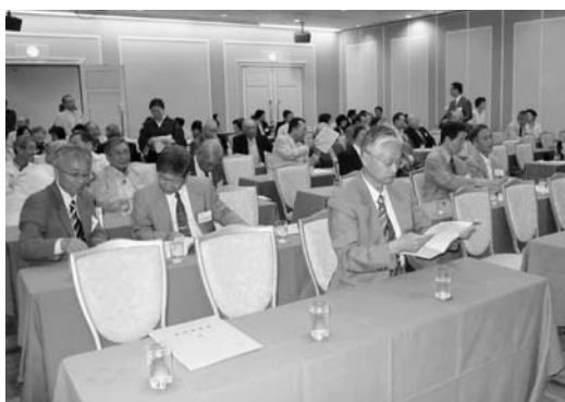
定期総会開始を待つ会場

終了いたしました。総会・懇親会の模様を一部ご紹介いたします。内容につきましては、庶務報告を御覧ください。