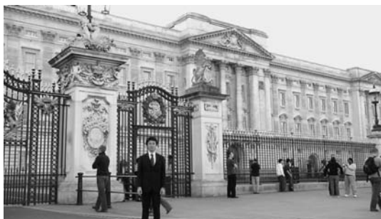
バッキンガム宮殿にて