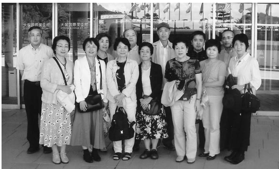
平成19年6月10日 於 大塚国際美術館

テルを出発、途中花のガーデンや野島断層（1995年1月17日午前5時46分に起った兵庫県南部地震で出来た断層；淡路島北淡町に保存）をみて、明石海峡大橋の下の道の駅でお土産等を調達し最後の解散地三の宮へと向かった。この中華街で昼食をとり、それぞれ帰路について、今回の同窓会も無事終了した。