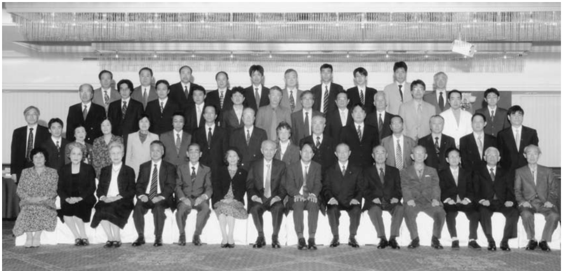
第三回 長崎大学薬学部地域薬剤師 卒後教育研修センター講演会 平成19年10月20日 懇親会での記念写真

研究所及びテキサス大学において延べ23年に亘って研究を続けておられます。専門はプロテオミクスの研究ですが、今回の講演では「プロテオミクスの新展開」と題して、最先端のプロテオミクスの研究状況を、これまでの研究経過や成果を交えながら分かりやすくお話しいただきました。ポストゲノム時代の一翼を担うプロテオミクス研究における癌など重篤な疾病のマーカー検索やこれからの研究の方向性など、さらに理解が深められたと思います。