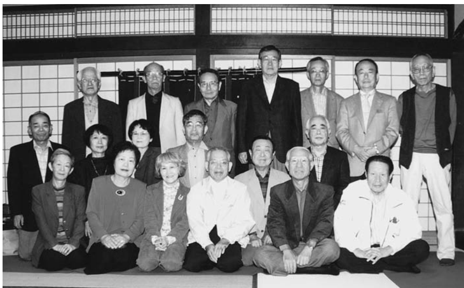
平成19年10月28日 於 松亭