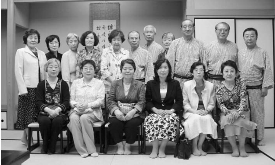
2007年6月10日 於 花やしき浮舟