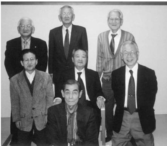
平成19年3月21日 於 セントヒル長崎