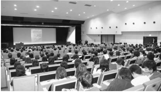
満席となった中部講堂