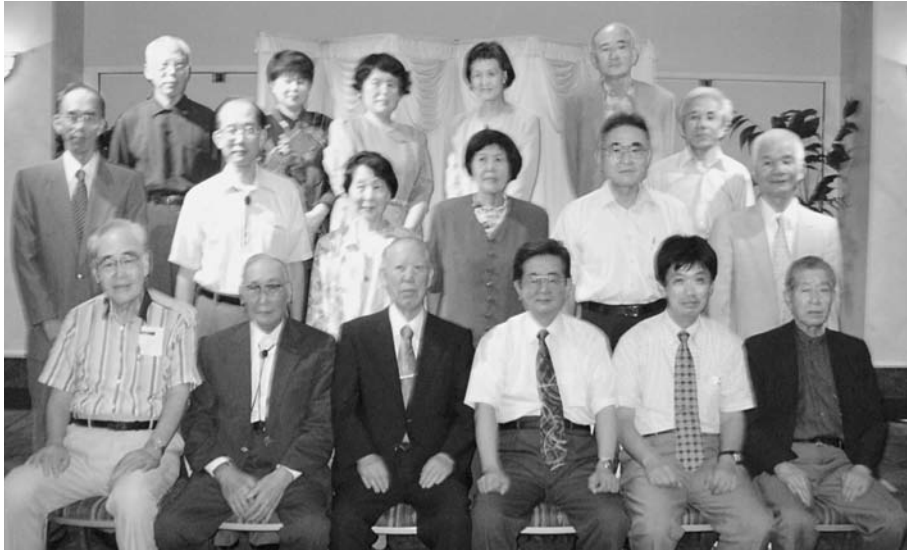
平成19年7月22日 於 グランドパレス