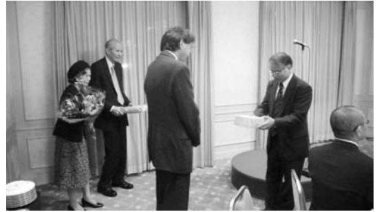
学部長より記念品の贈呈