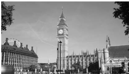
英国国会議事堂（ビッグベン）

続いて、ロンドンに移動した。今回の旅行で一番感動した街であった。事前情報では、食事もイマイチだし…ということもあり、あまり期待していなかったが、都会の中にあっても歴史や自然との調和が感じられ、また紅葉の時期ということもあり非常に過しやすかった。大英博物館、国会議事堂（ビッグベン）、バッキンガム宮殿等々の名立たる建物を拝見し、ロンドンバスや地下鉄へ乗車し、ロンドン中心部のハロッズで買い物など充実した時間を過ごすことができた。食事は、聞いていたほど悪くなかった。というか、ビールがあれば何でもおいしく感じられた。フィッシュ&チップ