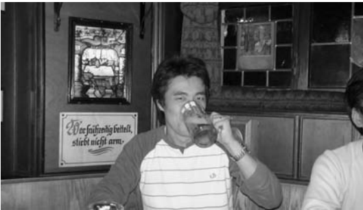
ビールに興じる筆者

あ～このままこの地に留まるのも悪くないな～と思っていたら、もう帰国の途。あつという間の11日間であった。