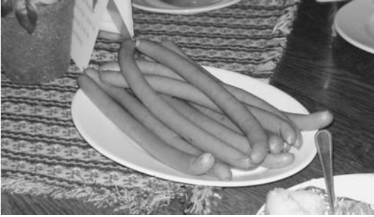
フランクフルト in フランクフルト