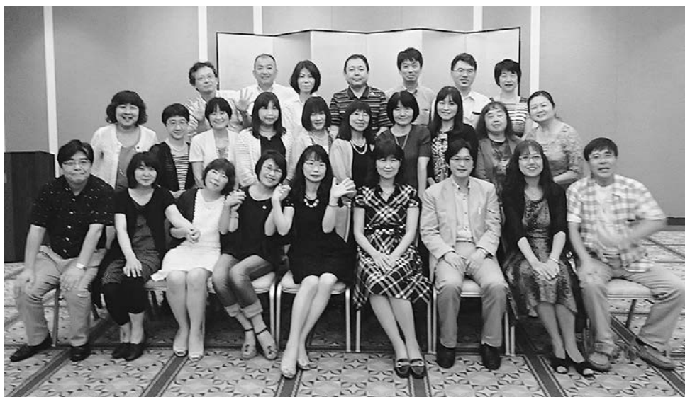
平成26年7月20日 於 ホテルグランビア大阪