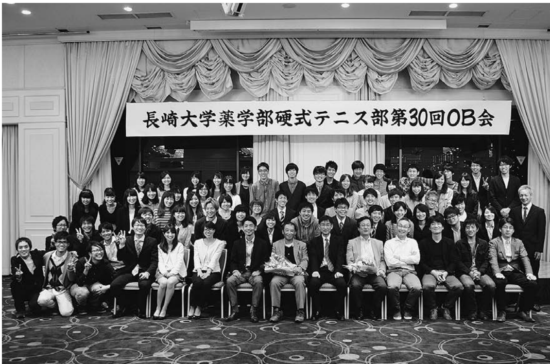
平成26年11月1日 於 サンプリエール

長崎大学薬学硬式庭球部OB会も節目の30回を迎え、これからもさらに発展していくことと思われます。今年は残念ながら出席できなかった先輩方もご都合がつかましたら、来年のOB会に是非ご参加下さい。現役一同、心よりお待ちしております。