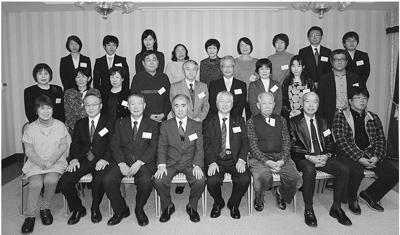
平成26年1月25日 於 大分オアシスタワーホテル