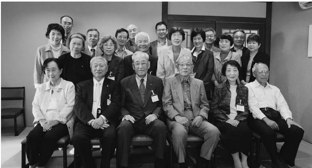
平成26年10月26日 於 中華茶寮「百葉」