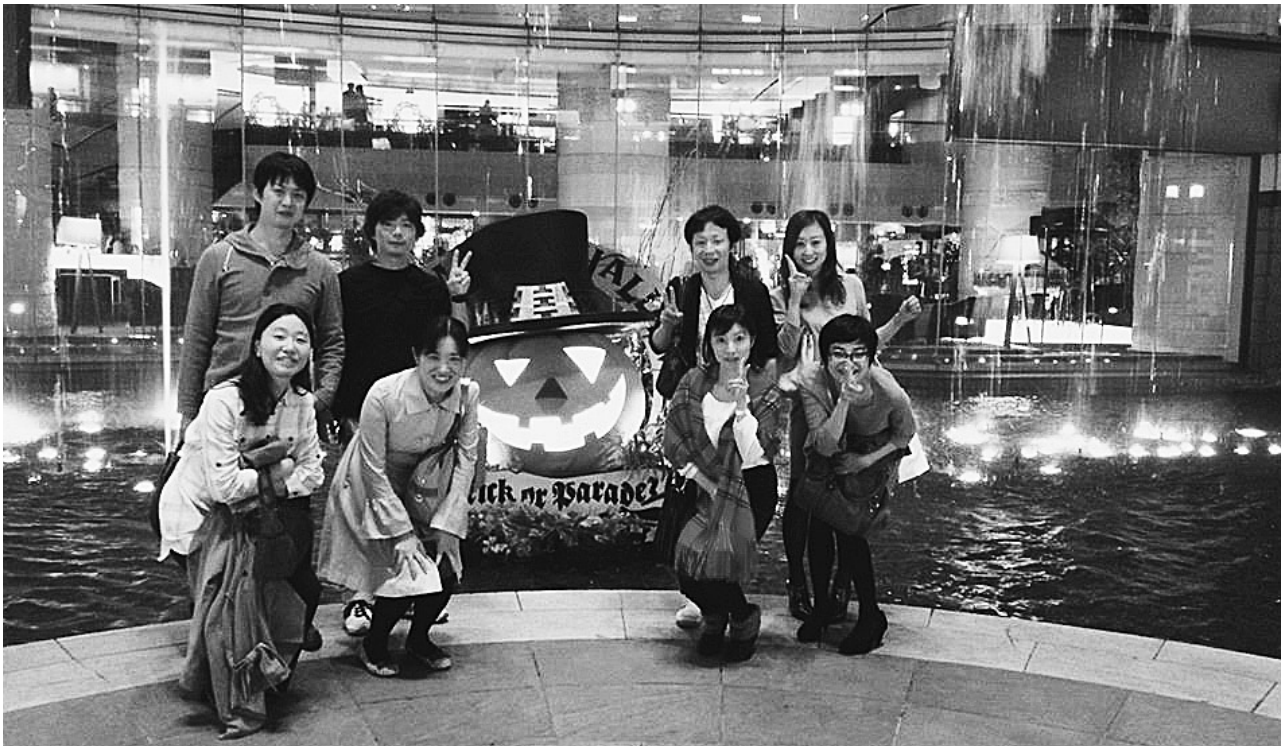
平成26年10月18日 於 グランドハイアット

昨今の学生たちが柏葉会館と縁遠くなっていることを耳にし、老婆心ながら警鐘を鳴らしておきたい。と少々脱線気味であるが、とにかく次回開催に当たってはぜひ長葉同窓会のお力を拝借したいことを挙げさせて頂きまして筆を置きたいと思います。