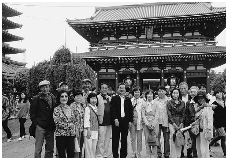
平成26年5月13日 於 浅草寺

再来年は、卒業50周年クラス会を長崎で開催しますので、健康管理に努め、思い出の長崎でお会いしましょう。