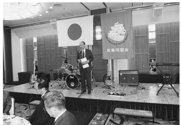
長崎支部ぐびろ会会長挨拶