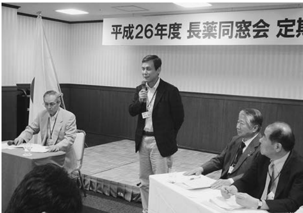
北九州支部長挨拶