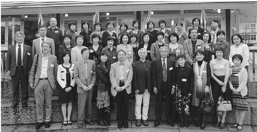
平成25年11月3日 於 水辺の公園レストラン