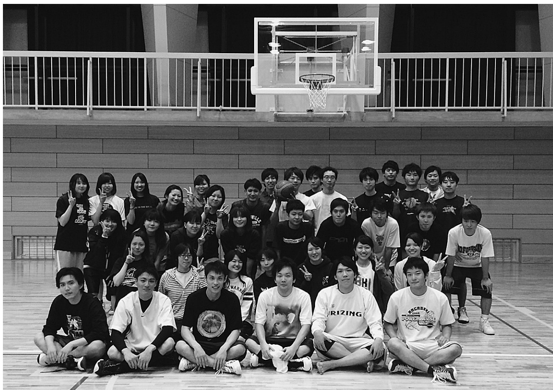
平成26年11月2日 於 長崎大学総合体育館

薬学バスケットボール部OB戦は4回目とまだまだ歴史は浅いですが、今後とも繋がりを大切にして、発展していければと思います。今回は残念ながら参加できなかった先輩方もご都合がつかましたら、来年のOB戦に是非ご参加ください。現役生一同心よりお待ちしております。