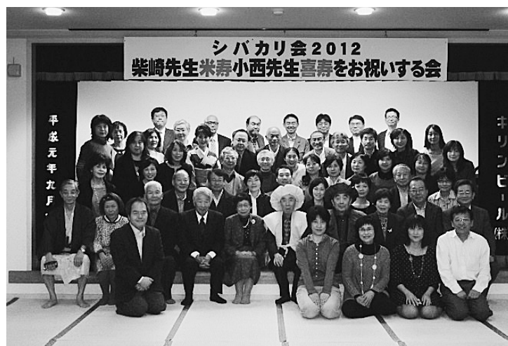
平成24年11月10日 於 二日市温泉 大観荘