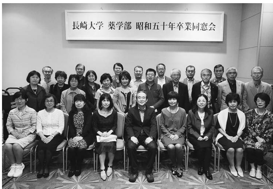
平成26年9月20日 於 JRタワーホテル日航札幌