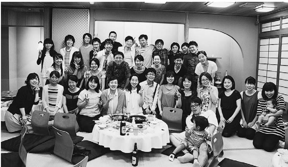
平成26年7月20日 於 銀鍋