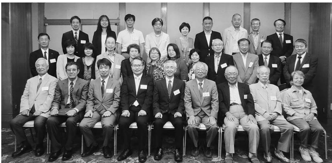
平成26年10月11日 於 大阪弥生会館